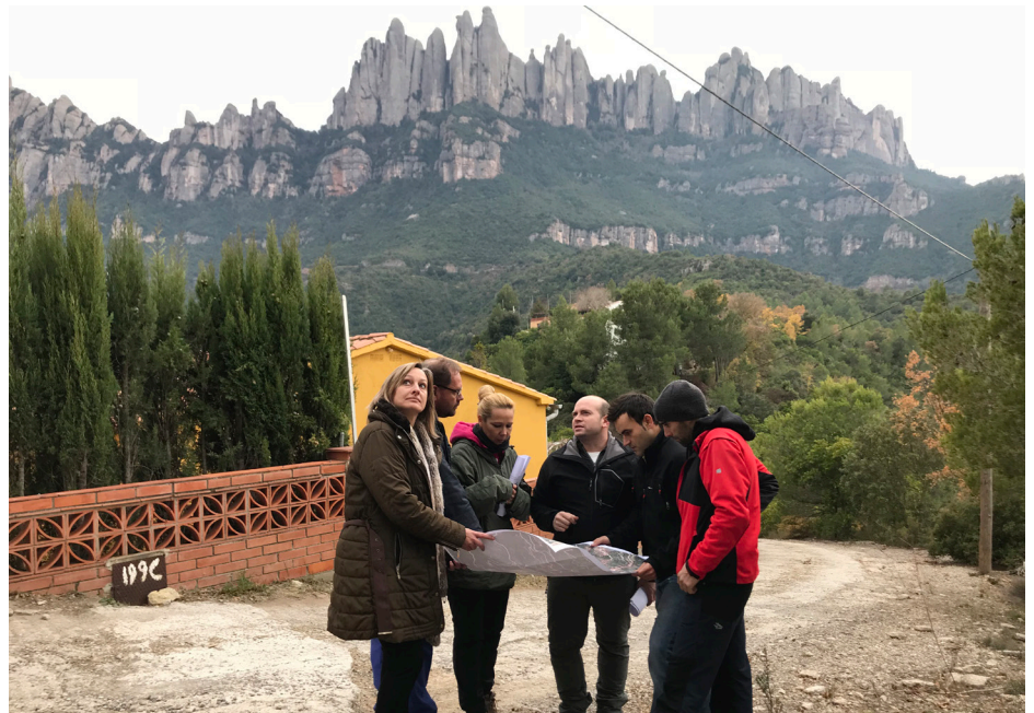
Reunió política i tècnica del passat 18 d'octubre a la zona on s'iniciaran els treballs de neteja

Per aquesta singularitat, la seva localització en el Parc Natural de la Muntanya de Montserrat, i l'envergadura (24,6 hectàrees) ha rebut i rebrà un tractament